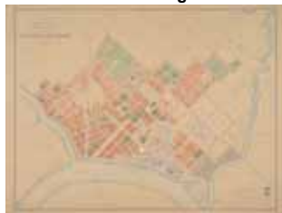
Plan de la ville de Saigon 1893